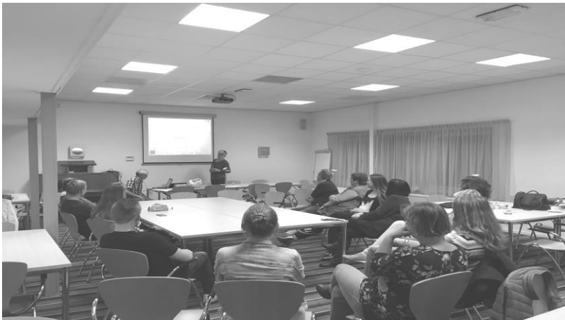
Foto bijeenkomst over de Roemeniëreis